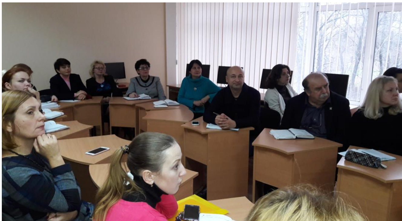
Фото / відеоматеріали